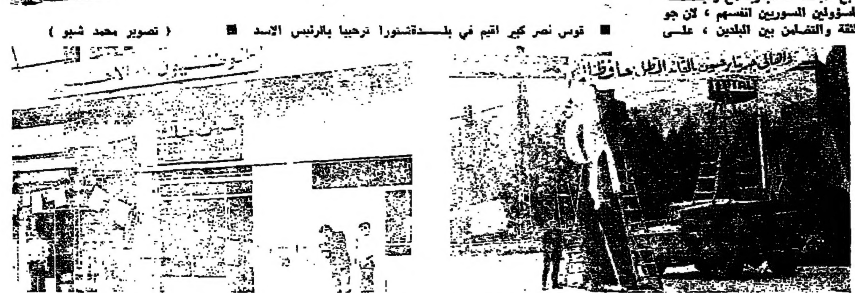
فوس نصر كبير أقيم في بلدة شتورا ترحيباً بالرئيس الأسد